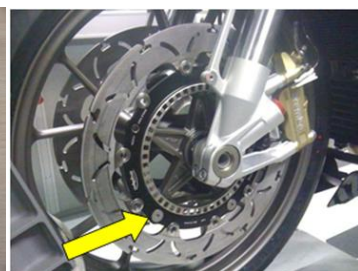
Einbauhinweise beachten/Fitting instructions